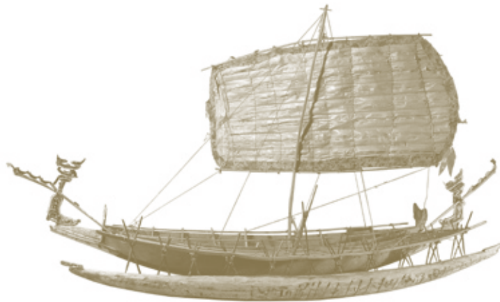
Modellboot aus Papua-Neuguinea, vor 1973

So 9. Dez. 2018 10.00 – 19.30 Eintritt frei